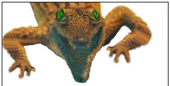
Arbeitsvorlage zum Erstellen einer Vektorgrafik (extrahiert in Adobe Photoshop CS 2)

Die Abbildung des Krokodils wirkt aktionsgeladend und spannend. Mit dem Slogan: „Wilder geht's nicht!“ wird dieser Aktion eine Aussage gegeben, mit der sich der Kunde positionieren möchte. Damit diese Position nicht mit einer Zoohandlung verwechselt werden kann und die Bildwirkung erhalten bleibt, entschieden wir uns für eine vektorbasierende grafische Umsetzung, die außerdem für eine professionelle Logoentwicklung erforderlich ist.