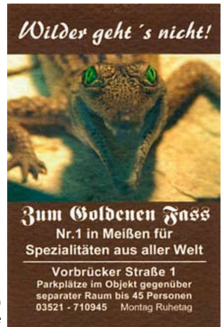
Visitenkarte (mit einer Bonuskarte auf der Rückseite) als vorgegebene Gestaltungsvorlage

Für uns ergab sich die Herausforderung, diese Identifizierung des Kunden gegenüber seinem herausragenden Angebot, überzeugend umzusetzen.